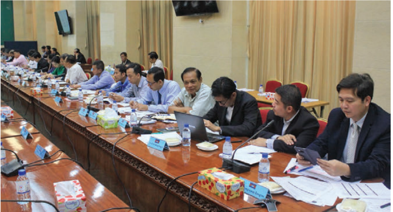
រូបភាពនៃកិច្ចប្រជុំស្តីពីស្ថានភាពសេដ្ឋកិច្ច សង្គមកិច្ច និងវប្បធម៌កម្ពុជា